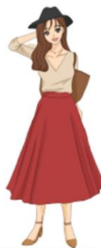
F-7 ライフジェニック